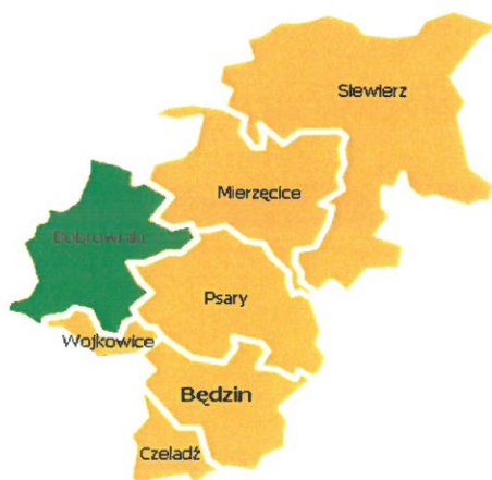
Rysunek 1. Gmina Bobrowniki w powiecie będzińskim

Gmina Bobrowniki zajmuje obszar 52 km 2 . Według danych GUS z końca 2015 roku Gmina liczy 11.881 mieszkańców, a gęstość zaludnienia to w przybliżeniu 231 osób/km 2 . Gmina Bobrowniki leży w zachodniej części powiatu będzińskiego. Bezpośrednio graniczy z następującymi jednostkami: Mierzęcice, Ożarówice, Piekary Śląskie, Psary, Świerklaniec, Wojkowice. Gmina położona jest w bliskim sąsiedztwie aglomeracji śląskiej i w bliskim sąsiedztwie Międzynarodowego Portu Lotniczego Katowice w Pyrzowicach, co daje jej duże szanse na możliwości rozwoju oraz tworzenie małego i średniego biznesu.