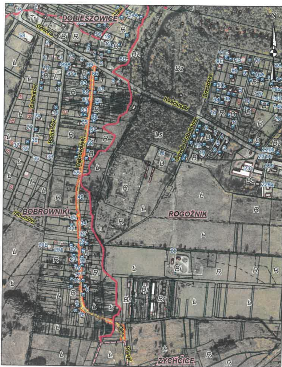
przebieg drogi gminnej: ul. Marii Dąbrowskiej w Bobrownikach