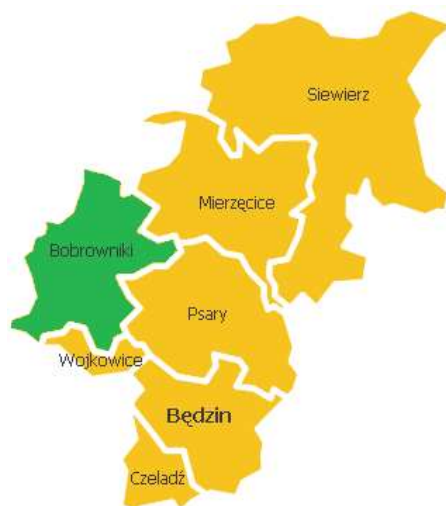
Rysunek 1. Gmina Bobrowniki w powiecie będzińskim

Gmina Bobrowniki zajmuje obszar 52 km 2 . Według danych GUS z końca 2020 roku Gmina liczy 12.122 mieszkańców, a gęstość zaludnienia to w przybliżeniu 233 osób/km 2 . Gmina Bobrowniki leży w zachodniej części powiatu będzińskiego. Bezpośrednio graniczy z następującymi jednostkami: Mierzęcice, Ożarówice, Piekary Śląskie, Psary, Świerklaniec, Wojkowice. Gmina położona jest w bliskim sąsiedztwie aglomeracji śląskiej co daje jej duże szanse na możliwości rozwoju oraz tworzenie małego i średniego biznesu.